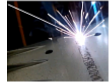
Marquage de numéros d'identification de véhicule pour l'automobile