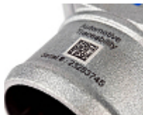
Marquage de numéro de série