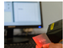
Suivi des données de production