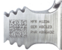
Normes de marquage de l'aérospatiale