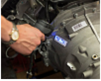
Logiciel de traçabilité