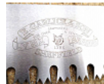
Marquage de logo