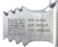
Normes de marquage de l'aérospatiale