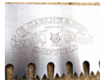
Marquage de logo